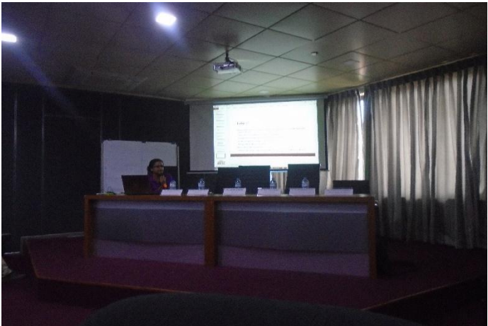
දුප්පත්කම අවම කිරීමේ මධ්‍යස්ථානයේ ජ්‍යෙෂ්ඨ පර්යේෂණ නිලධාරී වන්දිමා අරඹපොල මහත්මිය විසින් ඉදිපත් කිරීම් සිදු කරමින්.....