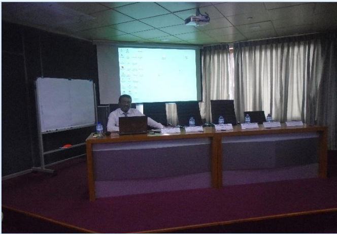
ශ්‍රී ලංකා විදේශ සේවා නියුක්ති කාර්යාලයේ නියෝජ්‍ය සාමාන්‍යාධිකාරී (නීති හා ගුවන්තොටුපල කටයුතු) කීර්ති මුතුකුමාරණ මහතා විසින් ඉදිපත් කිරීම් සිදු කරමින්.....